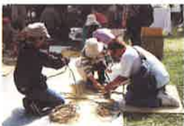
つるごび編み(有料)