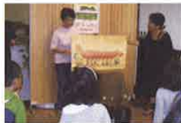
大型絵本の読み聞かせ