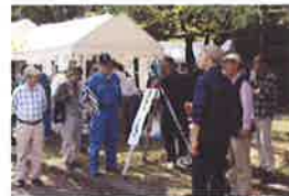
測量体験とパステル画