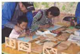
ミツノ間彫り体験(有料)