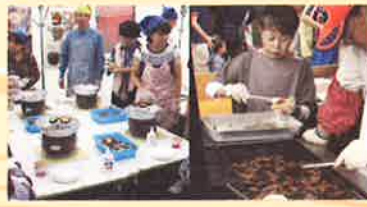
森の食材を活かしたフードコーナー