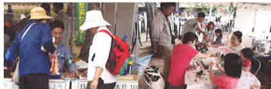
森林にまつわる研究体験