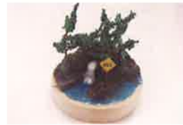
水源の森ジオラマづくり