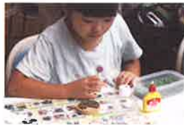
自然素材のクラフト