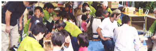
親子木工教室(小学生、イス作り)