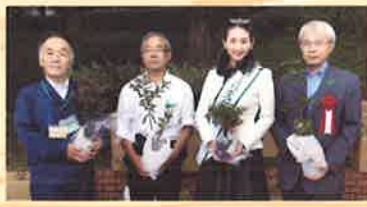
苗木プレゼント (数量限定、スタンブラー制)