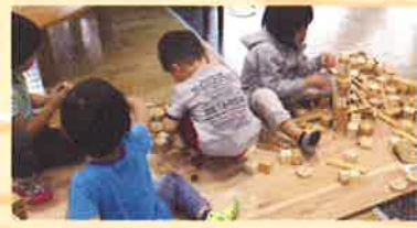
木と遊ぶキッズコーナー

主催:水都おおさか森林づくり・木づかい実行委員会 協賛:一般財団法人日本森林業振興会大阪支部/一般社団法人全国樹協 後援:国土交通省近畿地方整備局/近畿地方環境事務所/近畿農政局/三重県/滋賀県/京都府/奈良県/和歌山県/大阪市/大阪府教育委員会/滋賀県森林組合連合会/京都府森林組合連合会/奈良県森林組合連合会/兵庫県森林組合連合会/和歌山県森林組合連合会/滋賀県木材協会/一般社団法人京都府木材組合連合会/奈良県木材協同組合連合会/兵庫県木材協同組合連合会/和歌山県木材協同組合連合会/内閣府公益社団法人大阪府振友会/公益社団法人国土緑化推進機構/公益財団法人関西・大阪21世紀協会/公益財団法人国際花と緑の博覧会記念協会/帝国ホテル 大阪/産経新聞大阪本社/森林環境の保全・整備連絡調整会議