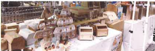
木のおもちゃ、イス、まな板、アクセサリなど木製品の販売