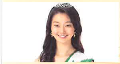
「ミス日本 みどりの女神」来場